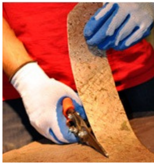
Fáciles de trabajar

La superficie a adherir las láminas de Tienda Bennet deben ser resistentes, estar limpias, secas y exentas de polvo y otras suciedades que pudieran perjudicar la adherencia. Se debe realizar una limpieza previa del dorso de la lámina con alcohol isopropílico y un trapo húmedo, al igual que la pared. Para conseguir una buena colocación, la superficie debe estar muy bien alisada.